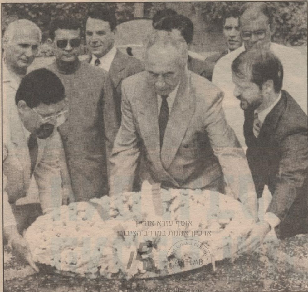
אוסף עזרא אורין ארכיון אמנות במרחב הציבורי