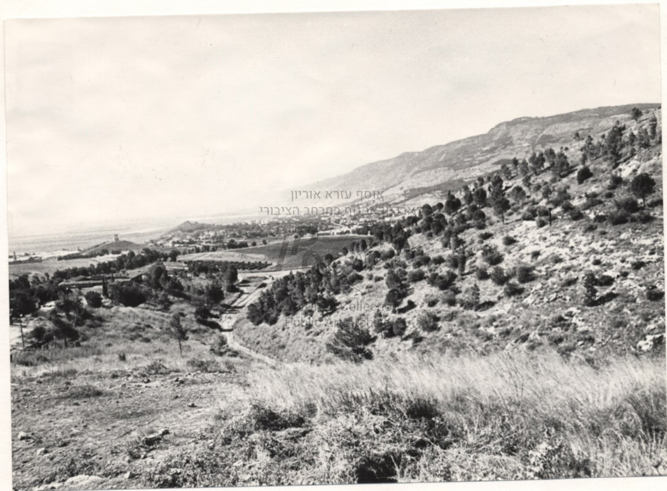
אוסף עזרא אוריון ואנדרטת אלוהים במרחב הציבורי