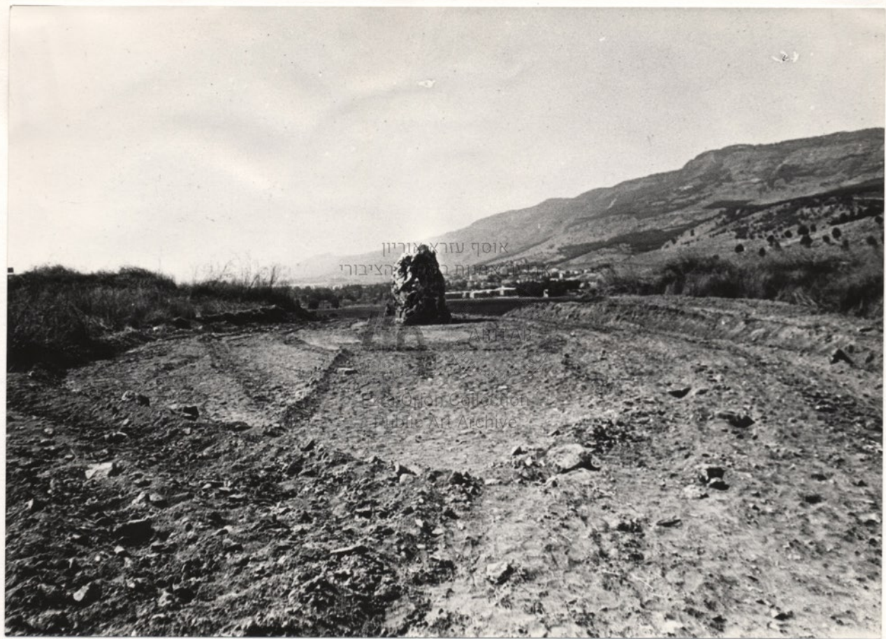
אוסף עזרא אוריון האגודה להצילובי

© 2011 by the Hebrew University of Jerusalem All Rights Reserved