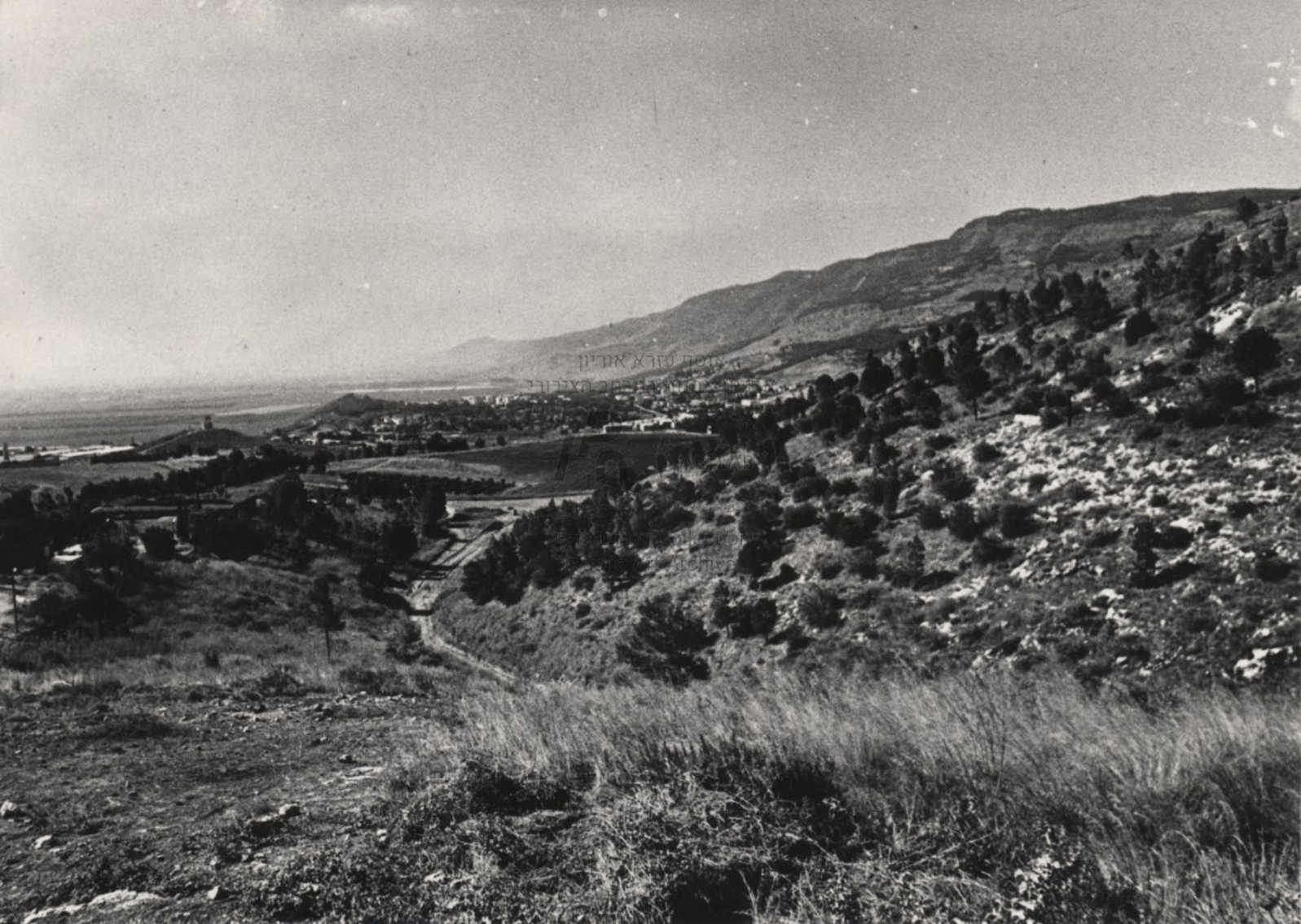
צומת עזרא אורון המבט מן ההר אל הים