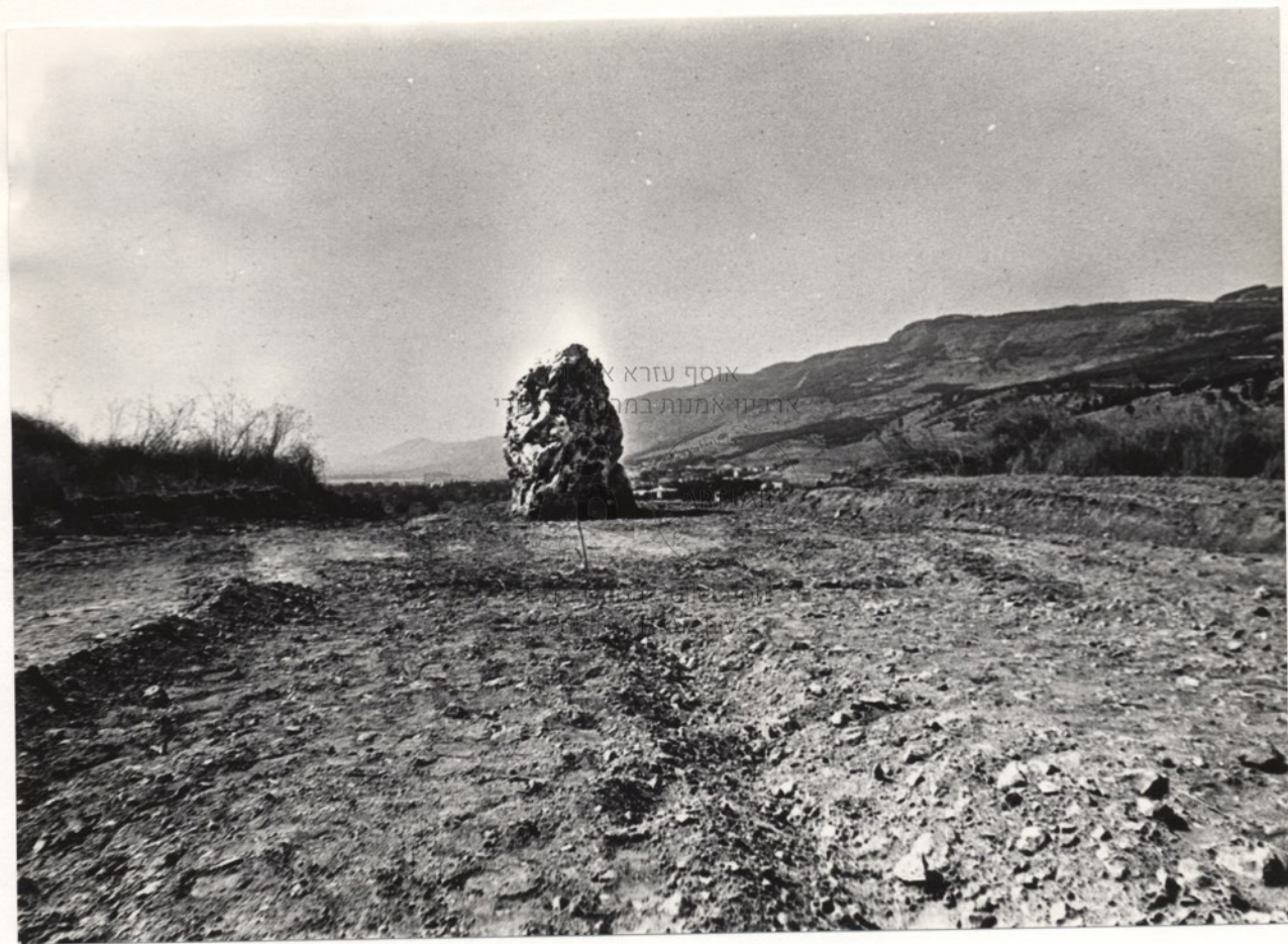
אוסף עזרא א. אדמוני-אמנות במחנה